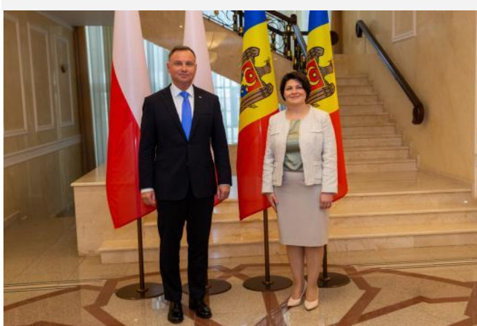
Prim-ministrul Natalia Gavrilița a avut o întrevedere cu președintele Republicii Polone, Andrzej Duda