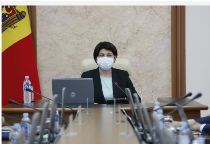
Executivul a aprobat Conceptul serviciului guvernamental de livrare (MDelivery)