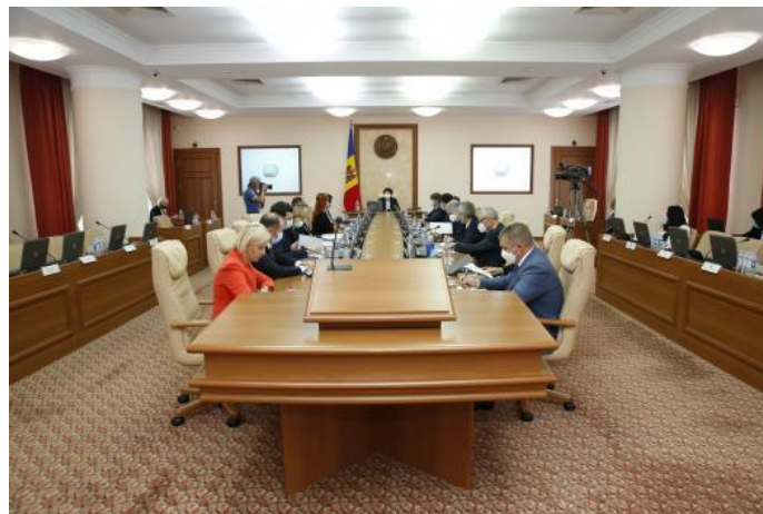
Republica Moldova va încheia un Acord cu Republica Lituania privind convertirea permiselor de conducere