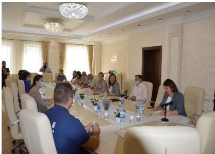
Biroul relații cu diaspora a participat în cadrul Zilelor Diasporei la nivel local desfășurate în s. Avdarma, UTA Găgăuzia