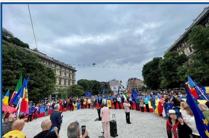
Adunarea „Moldova Europeană” – Milano