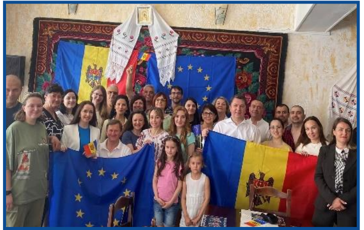
Adunarea „Moldova Europeană” – Praga