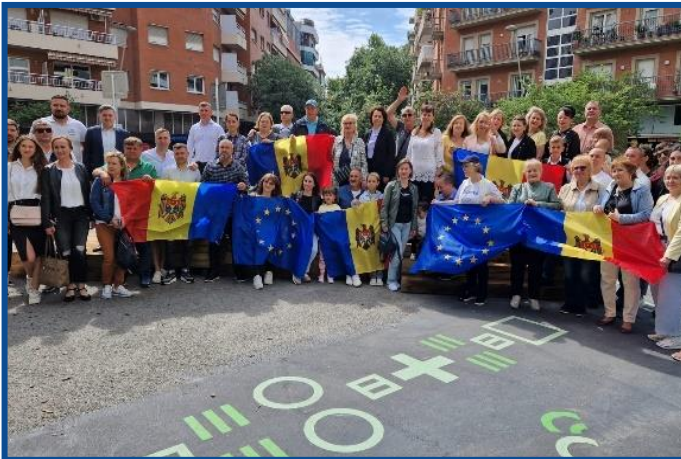
Adunarea „Moldova Europeană” – Barcelona