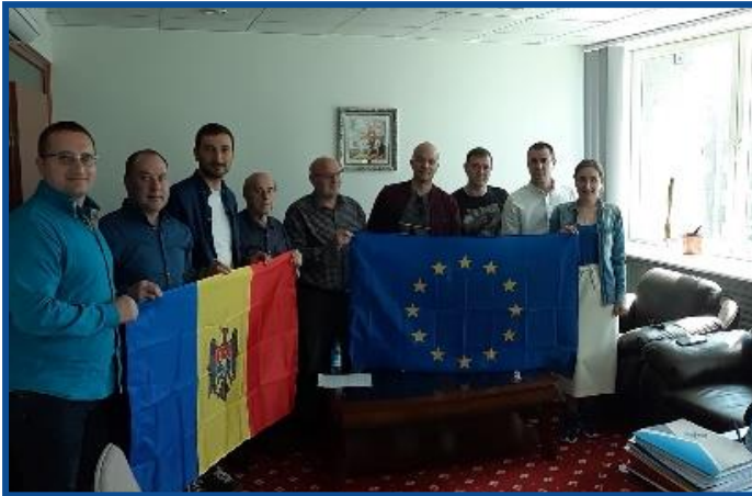
Adunarea „Moldova Europeană” – Tallin