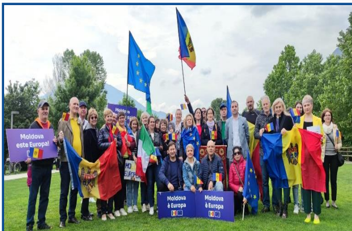
Adunarea „Moldova Europeană” – Trento