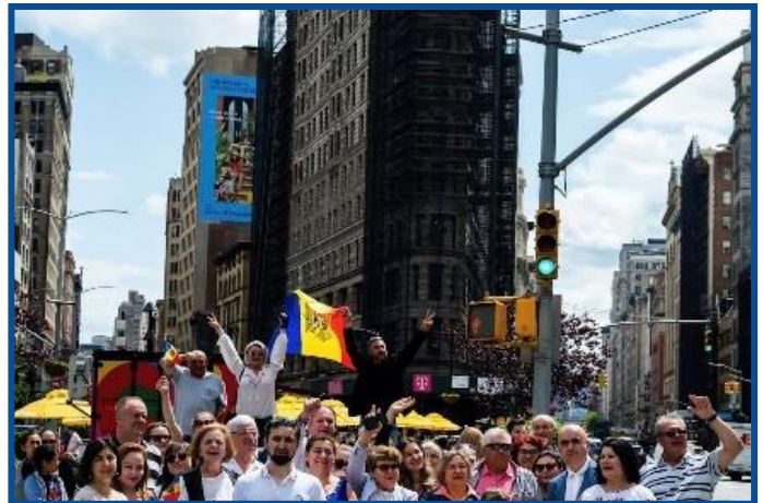
Adunarea „Moldova Europeană” – New York