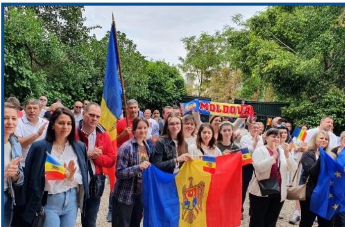
Adunarea „Moldova Europeană” – Lisabona