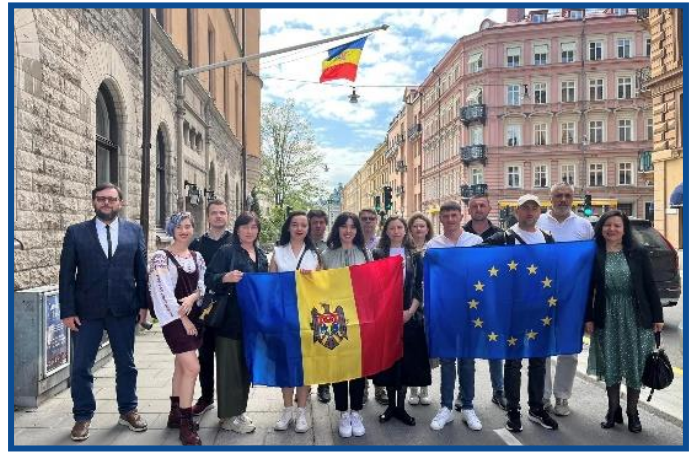
Adunarea „Moldova Europeană” – Stockholm