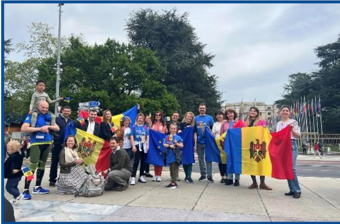
Adunarea „Moldova Europeană” – Geneva