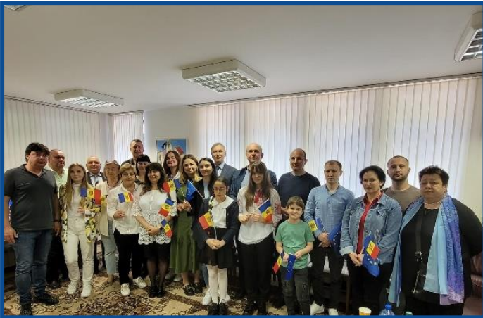
Adunarea „Moldova Europeană” – Sofia