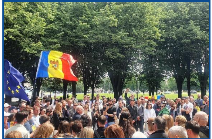
Adunarea „Moldova Europeană” – Paris