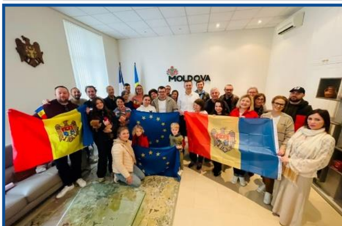
Adunarea „Moldova Europeană” – Nisa