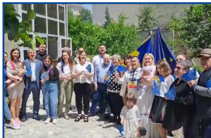
Adunarea „Moldova Europeană” – Baku