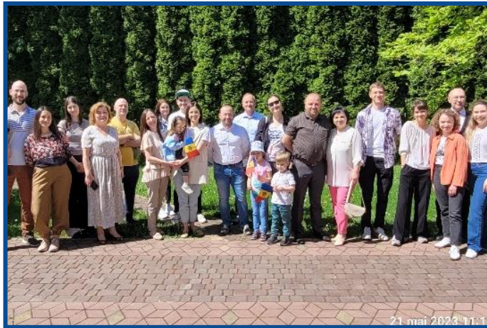
Adunarea „Moldova Europeană” – Varșovia