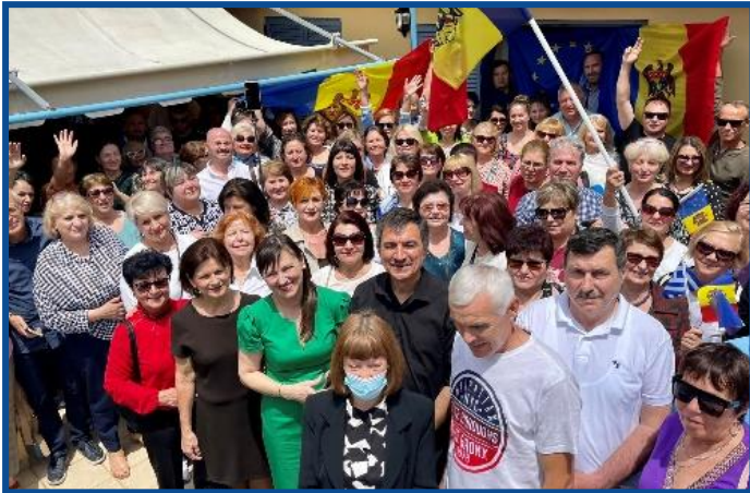
Adunarea „Moldova Europeană” – Atena