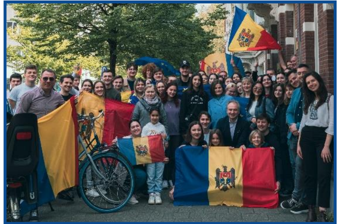
Adunarea „Moldova Europeană” – Haga