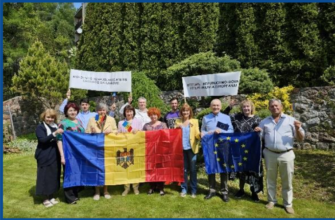
Adunarea „Moldova Europeană” – Vilnius