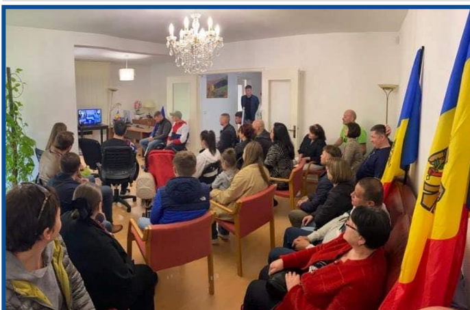
Adunarea „Moldova Europeană” – Strasbourg