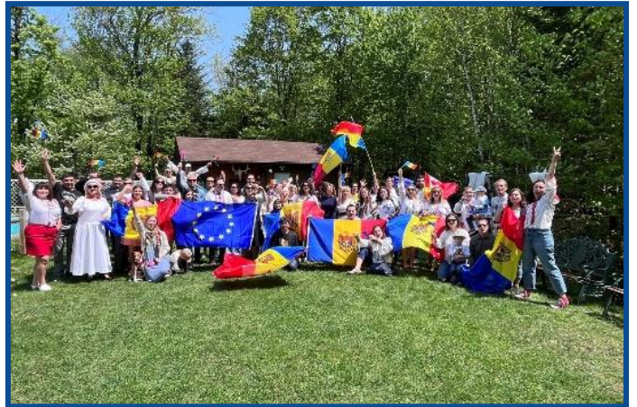
Adunarea „Moldova Europeană” – Montreal