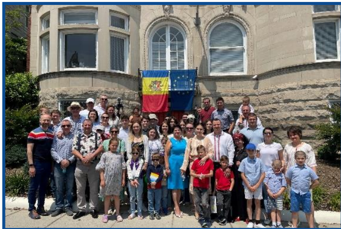
Adunarea „Moldova Europeană” – Washington D.C.