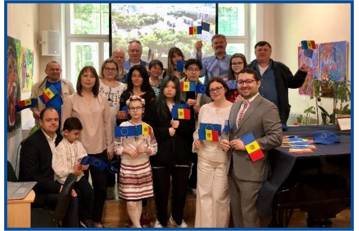
Adunarea „Moldova Europeană” – Riga