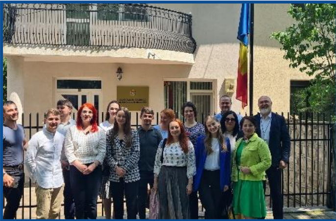
Adunarea „Moldova Europeană” – Iași