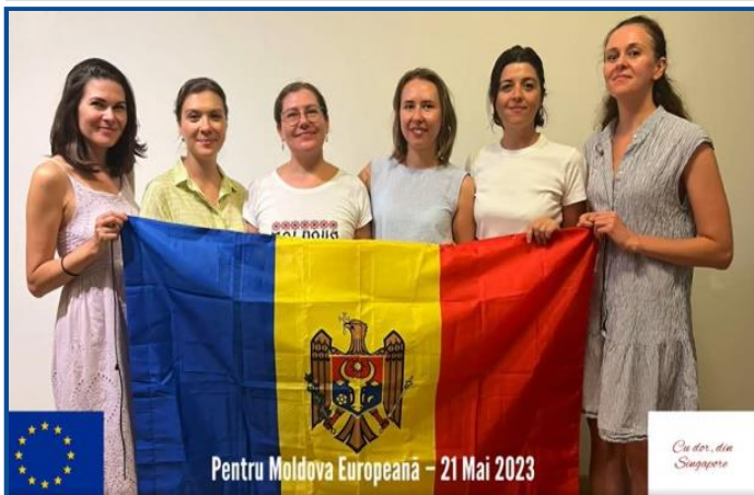
Adunarea „Moldova Europeană” – Singapore