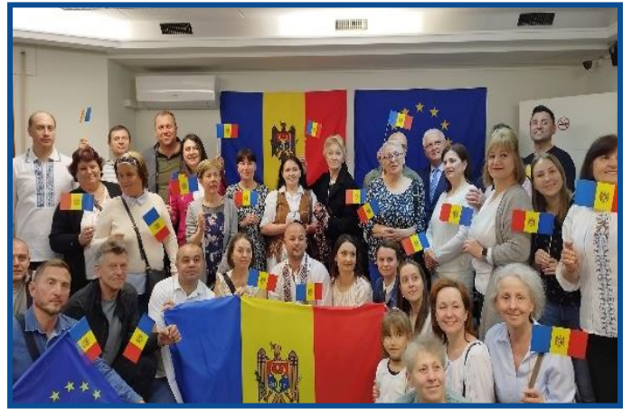
Adunarea „Moldova Europeană” – Madrid