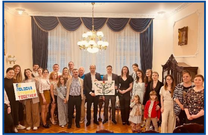
Adunarea „Moldova Europeană” – Budapesta