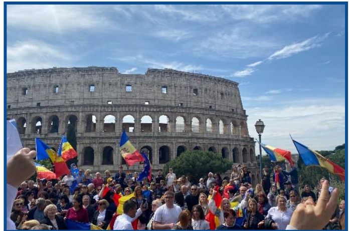
Adunarea „Moldova Europeană” – Roma