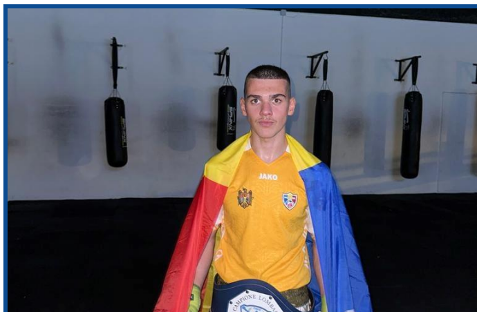
Fost participant la Programul guvernamental DOR, campion la Kickboxing