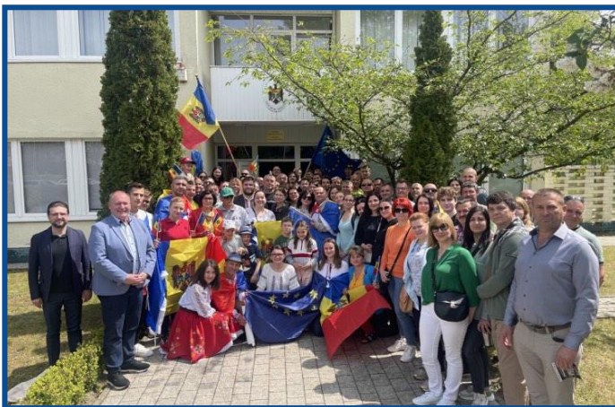
Adunarea „Moldova Europeană” – Berlin