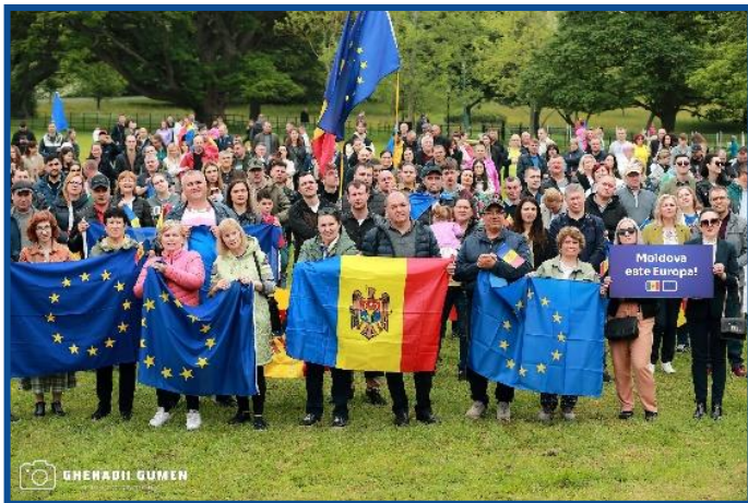
Adunarea „Moldova Europeană” – Dublin