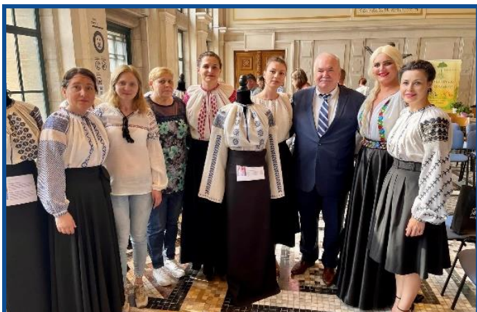
Membrele Grupului „Sezătoare Bruxelles” au participat la Diplomatic Bazar, desfășurat în Belgia