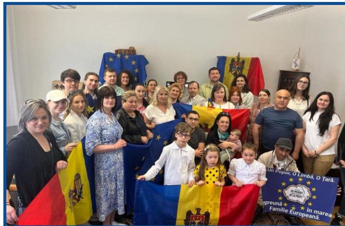
Adunarea „Moldova Europeană” – Viena