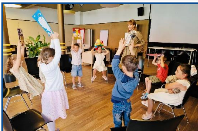
„Copilăria” a fost sărbătorită la Școala „Guguță” din Zurich