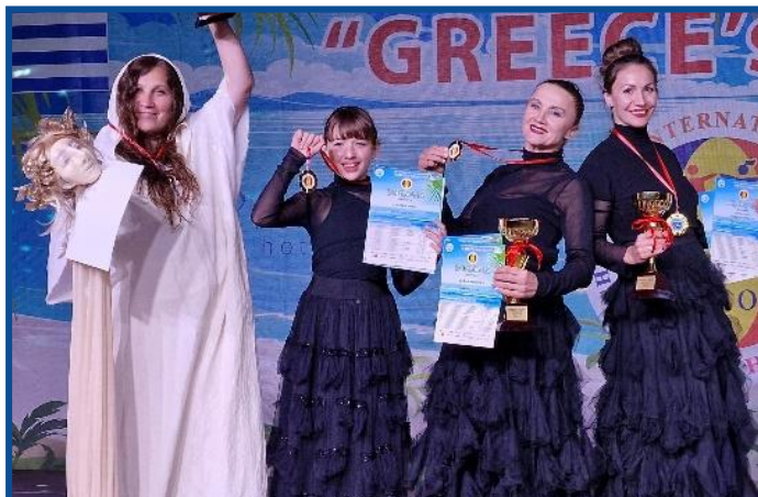
Diaspora din Grecia a participat la Festivalul „Greece's Hope”