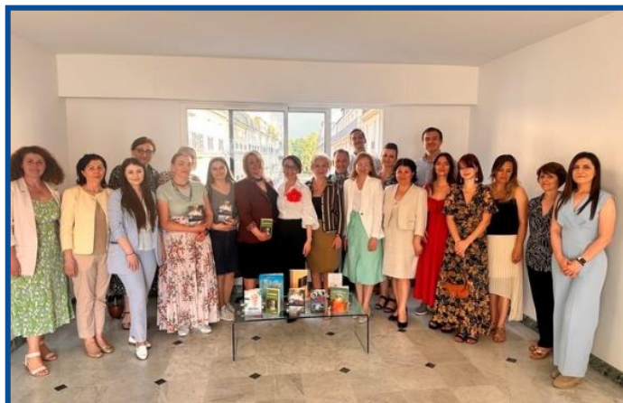
În Franța a fost organizată serata literată „Câtă viață, atâta literatură”, dedicată scriitoarei Lucreția Bârlădeanu, originară din Republica Moldova