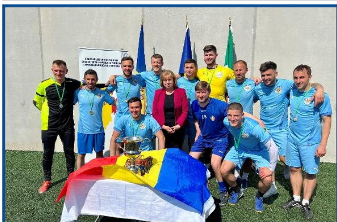
„Cupa Ambasadorului Republicii Moldova în Irlanda la Mini-fotbal 2023”, desfășurată la Dublin