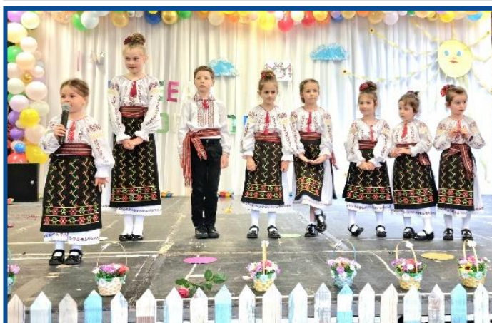
„În lumea copiilor” - program artistic prezentat de grupul de copii „Ciuboțica” din Marea Britanie