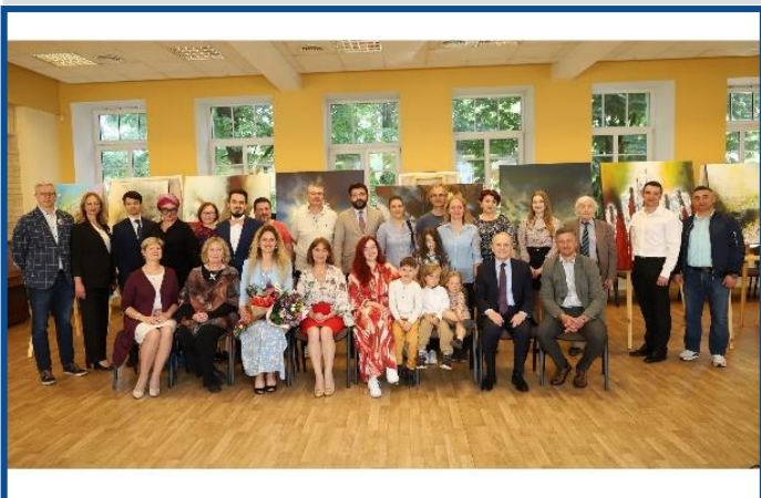
Diaspora din Vilnius a participat la vernisajul expoziției „Dincolo de stele”