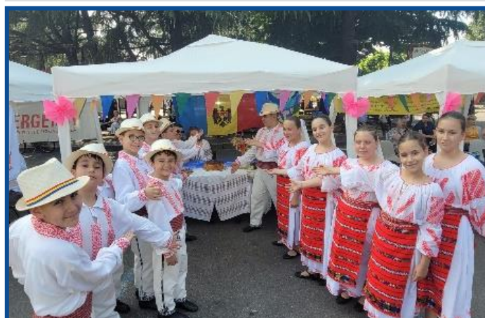
Ansamblul artistic „Mugurel” al școlii Grupul Vatra a participat la Festivalul Culturilor Lumii 2023, organizat în Rho (Milano)