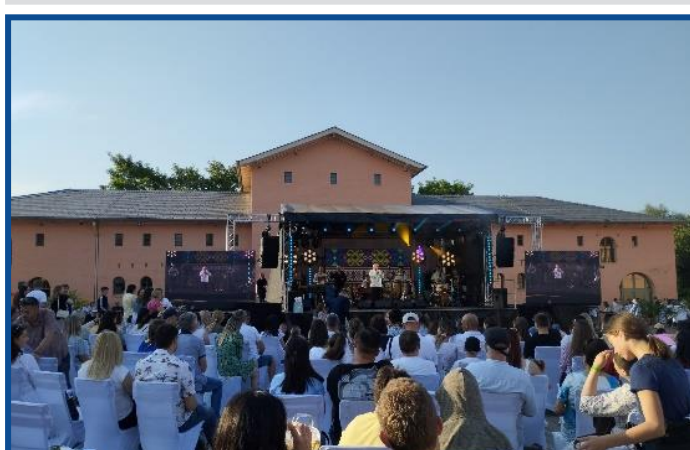
Conaționalii noștri din Germania au petrecut o zi deosebită la Festivalul „Dor călător”