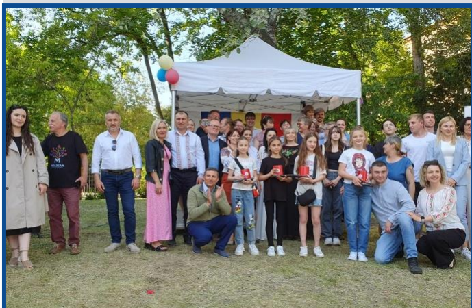
Un festival dedicat Zilei Internaționale a Copilului a fost organizat de către Asociația de prietenie moldo-germană