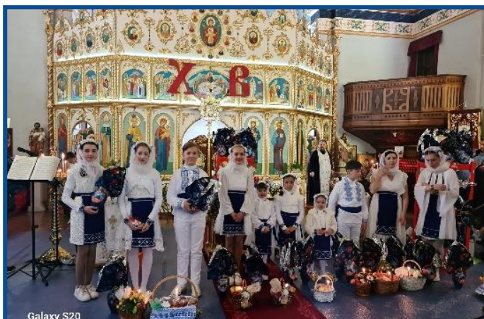
Membrii Ansamblului Folcloric „Cununița” au întâmpinat Sfânta Sărbătoare a Învierii Domnului