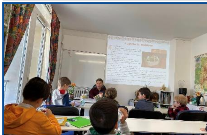
Despre Sfintele Sărbători de Paști s-a vorbit la lecția de limbă română, organizată de Asociația pentru Integrarea Migranților