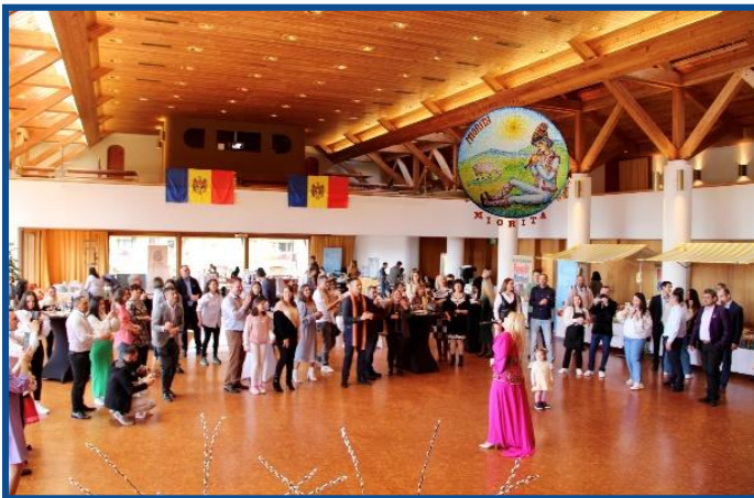
Moldovenii din Elveția au participat la concertul interpretei Nelly Ciobanu, organizat de Asociația „OurRoots - Diaspora Moldova în Elveția”