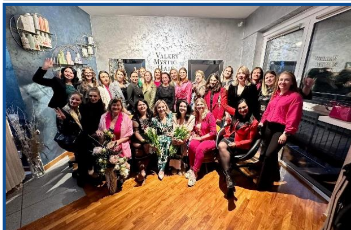
În Milano a avut loc un eveniment de suflet cu femeile din Comunitatea Ofemeie.com