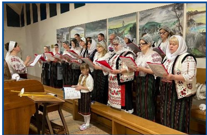
Paștele sărbătorit de către diaspora din Italia