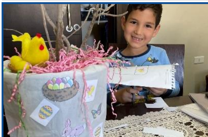
Paștele întâmpinat de către copiii de la Centrul Educațional-Cultural Moldovenesc