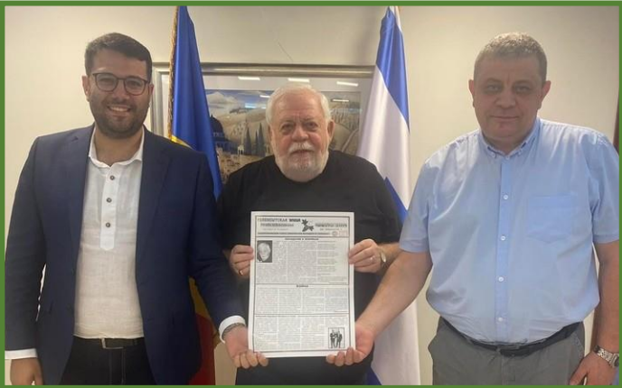
Președintele Asociației diasporei originarilor din orașul Telenești în vizită la Ambasada Republicii Moldova în Statul Israel