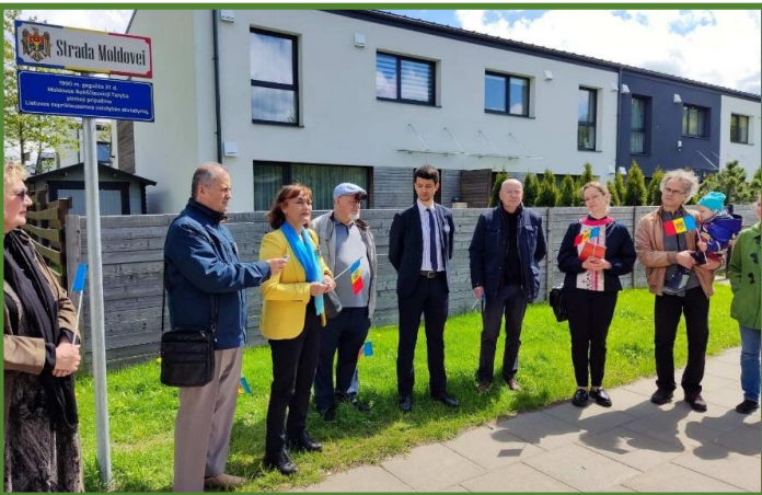
Inaugurarea oficială a plăcii comemorative pe strada Moldova din Vilnius