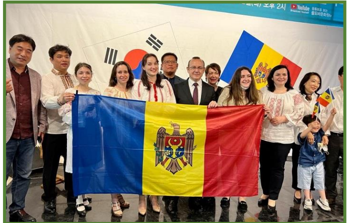
În orașul Gongju, Republica Coreea, a avut loc deschiderea festivă a Centrului cultural Moldova